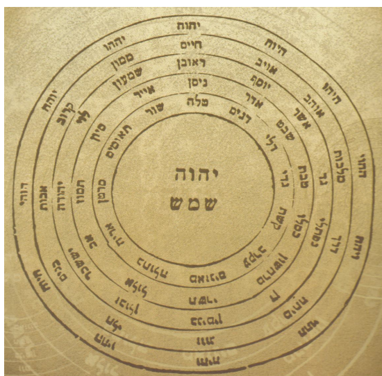
Рис. 0.32. Во втором кольце от центрального круга на иврите записаны названия 12 месяцев года: тишрей, кислев, шват, нисан, сиван, ав, хешван, тевет, адар, ияр, тамуз, элул . В периферийном кольце напротив месяцев записаны двенадцать комбинаций букв Непроизносимого Имени – т. е. «Двенадцать Знамен Времени» (0.49)

Каждый из 12 месяцев Освещен (т. е. Управляем) одним из двенадцати Имен Могуществ ТВОРЦА (0.49), как показано в каббалистической таблице на рис. 0.32 (репродукция из [33]).