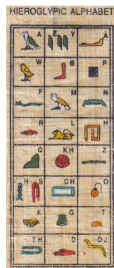
Рис. 0.29. Египетский алфавит