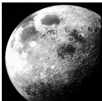
Рис. 0.34. Луна всегда повернута к Земле только одной стороной

В еврейской традиции чтобы указать на особенности лунного календаря, принято каждый год кодировать тремя еврейскими буквами (которые, как известно, имеют также числовые значения). Первая из них обозначает, в какой день недели будет Рош га-Шана, вторая – число дней в хешване и кислеве, третья – в какой день недели будет первый день Песаха (так как от него отсчитывают все остальные праздники). Например, кодом года 5720 (1959-1960) были буквы зайн – шин – гимел, что означало: Рош га-Шана пришелся на седьмой день недели, то есть Субботу (числовое значение буквы "зайн" – 7), хешван и кислев оба состоят из 30 дней ("шин" – сокращение слова "шлеймим", "полные"), Песах совпал с третьим днем недели, то есть со вторником (числовое значение буквы "гимел" – 3). Существует еще ряд факторов, определяющих строение еврейского календаря, см. "Тайну високосного года", а также "Страницы обычая и закона" А. Ц. Меламеда [20].