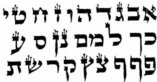
Рис. 0.41. Буквы иврита в кошерных свитках ТОРЫ имеют коронки из возвышающихся букв ז (зайн)

Различные степени повреждения во Внутренней ТОРЕ описываются коронками (рис. 0.41).