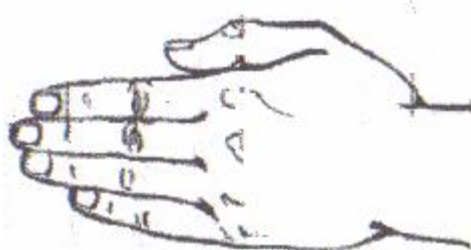
Рис. 0.77. Левая рука человека