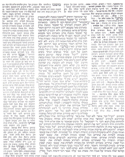
Рис. 0.17. Иллюстрация «Наполненной Отсутственности»

Пример «Наполненной Отсутственности» приведен на рис. 0.17. Для знающих иврит и шриффт Раши данное поле символов (страница Талмуда) наполнено глубоким смыслом и Светом Знания. Напротив, для незнающих