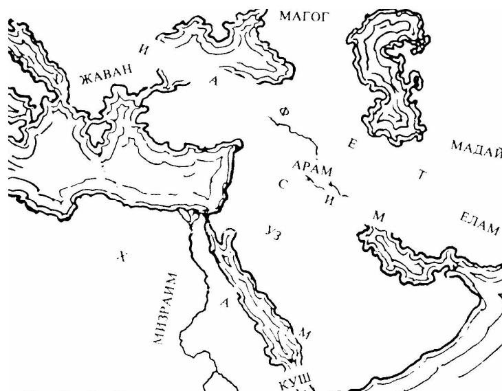
Рис. 1.14. Послепотопное расселение народов на Ближнем востоке

Б-Г не раз Гневался на израильтян за их колдовство: «Так Говорит ГОСПОДЬ Б-Г: «Горе сишивающим чародейные мешочки под мышки и делающим покрывала для головы всякого роста, чтобы уловлять души! Неужели, уловляя души народа МОЕГО, вы спасаете ваши души?... вот, Я на ваши чародейные мешочки, которыми вы там уловляете души, чтобы они прилетали, и вырву их из-под мышиц ваших и пущу на свободу души, которые уловляете, чтобы прилетали к вам (Библия, Иезекииль, 13:18 – 20).