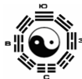
Рис. 1.5. Система триад Фу Си

Примечательная история повествуется в Мегилат Эстер (Книге Есфирь). Из-за того, что еврей Мардехей отказывался кланяться сановнику персидского царя Аману так, как это делали другие, этот сановник счел ничтожным расправиться с одним только Мардехеем и решил уничтожить весь еврейский народ, живший во владениях царя Артаксеркса. Чтобы назначить день избения евреев «в первый месяц, который есть месяц Нисан, в двенадцатый год царя Артаксеркса, бросали пур, то есть жребий, пред лицом Амана, изо дня в день и из месяца в месяц, и пал жребий на двенадцатый месяц, то есть на месяц Адар... и тринадцатое число» (Есфирь, 3: 7). Избиение по жребию и по слову царя не могло не произойти, и оно произошло. Но по воле Б-ЖИЕИ погибли не иудеи. В тот день сами иудеи избили своих врагов. С тех пор евреи в тринадцатый (а вне Израиля и в четырнадцатый) день двенадцатого месяца празднуют Пурим. Мегилат Эстер должен стать неотъемлемым пособием к любому учебнику по теории вероятности. Ибо знающие принимают, что и жребий в руках ВСЕВЫШНЕГО.