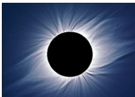
Рис. 0.68. Ужас Солнечного затмения. Диск Луны в точности совпадает с диском Солнца

Рашби (рабби Шимон Бен Йохай) учил: «Человек (буквально «плоть и кровь»), не знающий времен своих и мгновений своих, обязан прибавлять от будничного к Святому (к Субботе). Но СВЯТОЙ, Благословен ОН, Знающий Времена СВОИ и Мгновения СВОИ, Вошел в День седьмой (Шабат) с точностью Величайшей. Казалось, ОН Завершил Труд СВОЙ».