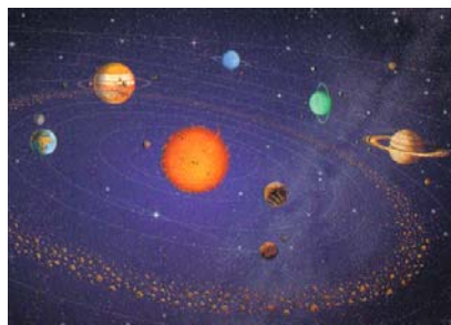
Рис. 0.69. Солнечная система