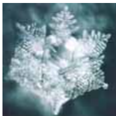
Кристалл родниковой воды