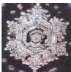
Кристалл воды после молитвы