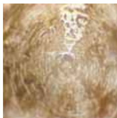
Замерзшая вода после звуковой какофонии