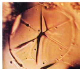
Начало образования кристалла вод