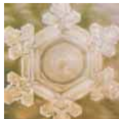
Кристалл воды после слова "спасибо"