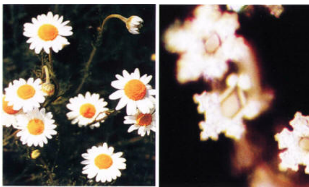
0.75. Ромашки и кристаллы ромашковой воды

Передача зарядового рисунка оболочек кластеров может рассматриваться как информационный процесс, поэтому каждая такая микрофаза водной среды фактически становится ее информационно-фазовым состоянием [34].